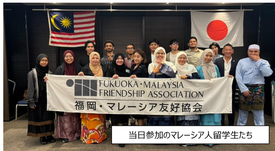
当日参加のマレーシア人留学生たち