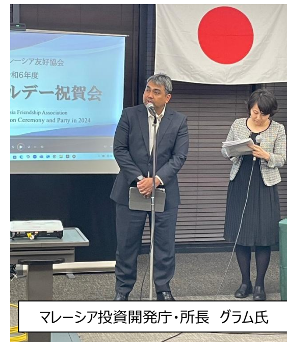
マレーシア投資開発庁・所長 グラム氏